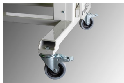
Hjul är standard och gör att du kan flytta din kantvik med lätthet.