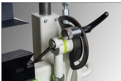
Enkel anpassning av bockningsvinkel med handtag för snabbjustering.