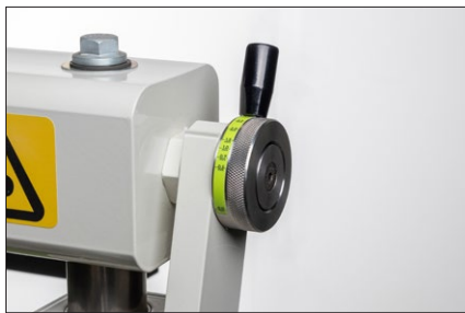
Justering av presstryck för bästa resultat och enkelt att ställa in.