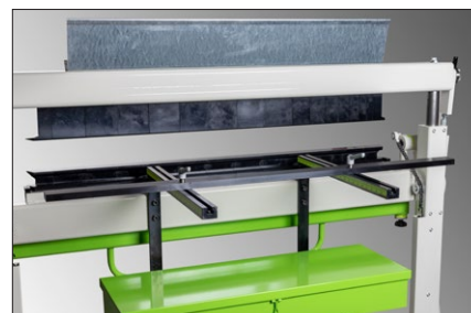
Den t-formade anslagskenan tillåter flexibla inställningar och möjlighet till hög reperterbarhet. Max anslagsdjup 585 mm. (Tillval)