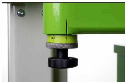
Justera plättjockleken när du jobbar för ett perfekt resultat.