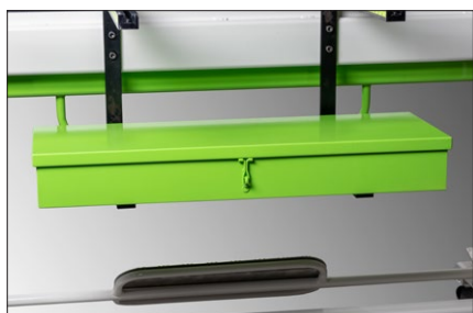
En smart förvaringslåda för verktyg och lådverktyg är standard.