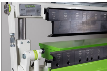
100 mm höga lådverktyg med snabbblåsning, enkla att flytta. Generös öppningshöjd på 100 mm.