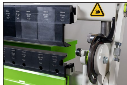
Hörnverktyg som standard för maximal flexibilitet. Verktygshöjd i underbalken är 60 mm och verktygen i böjbalken är 94 mm höga.